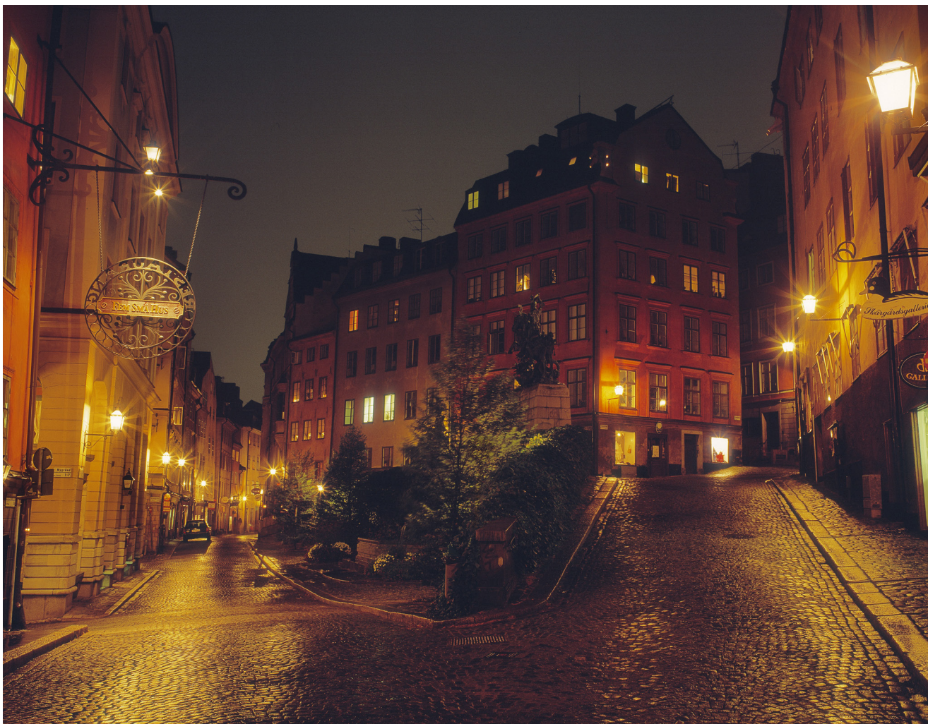
Casco antiguo de noche.