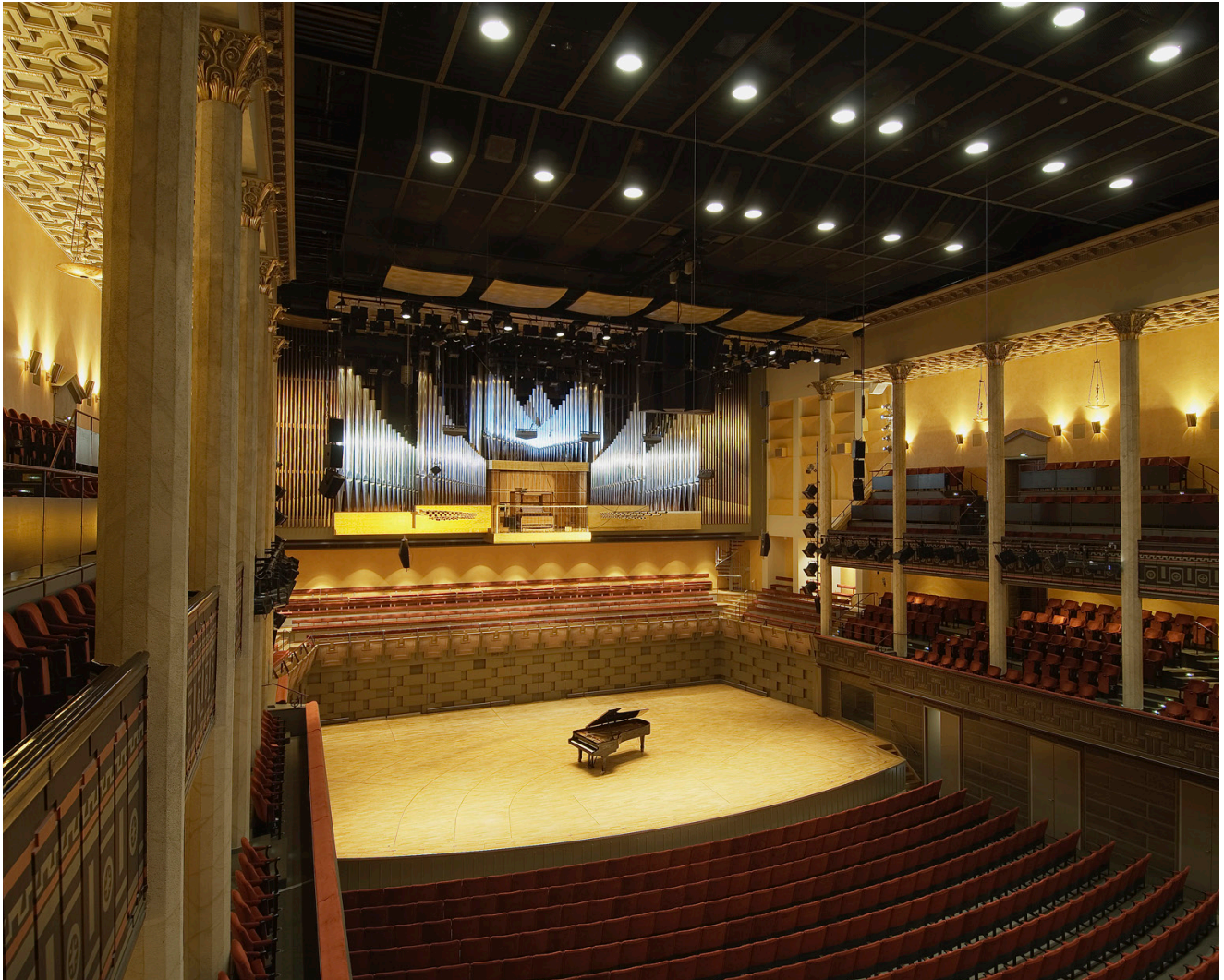
Konserthuset Estocolmo.