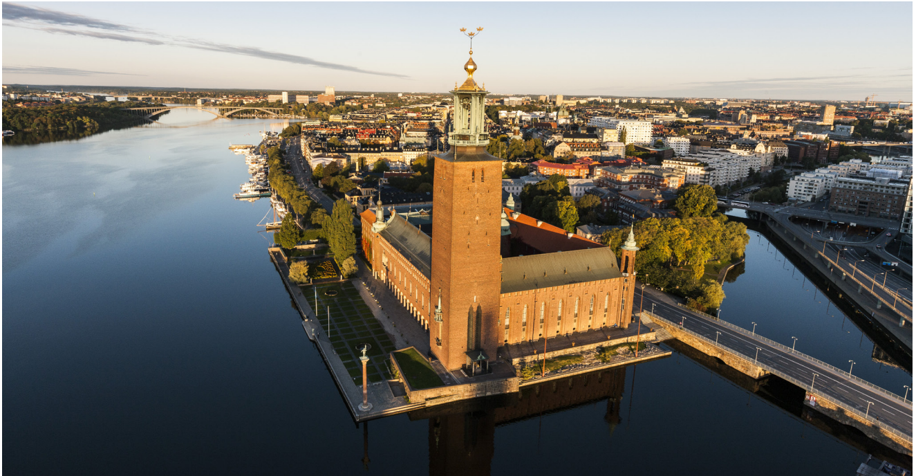
City Hall de Estocolmo.