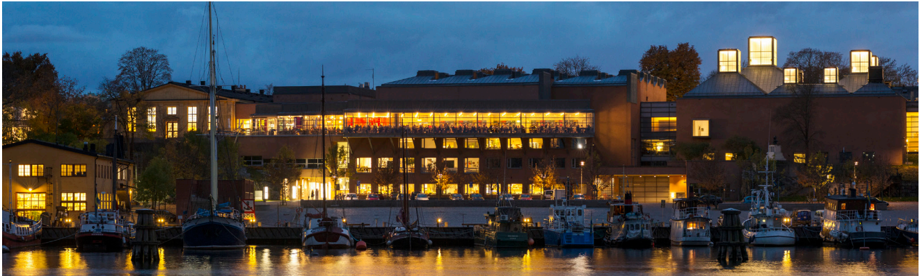
Moderna Museet.