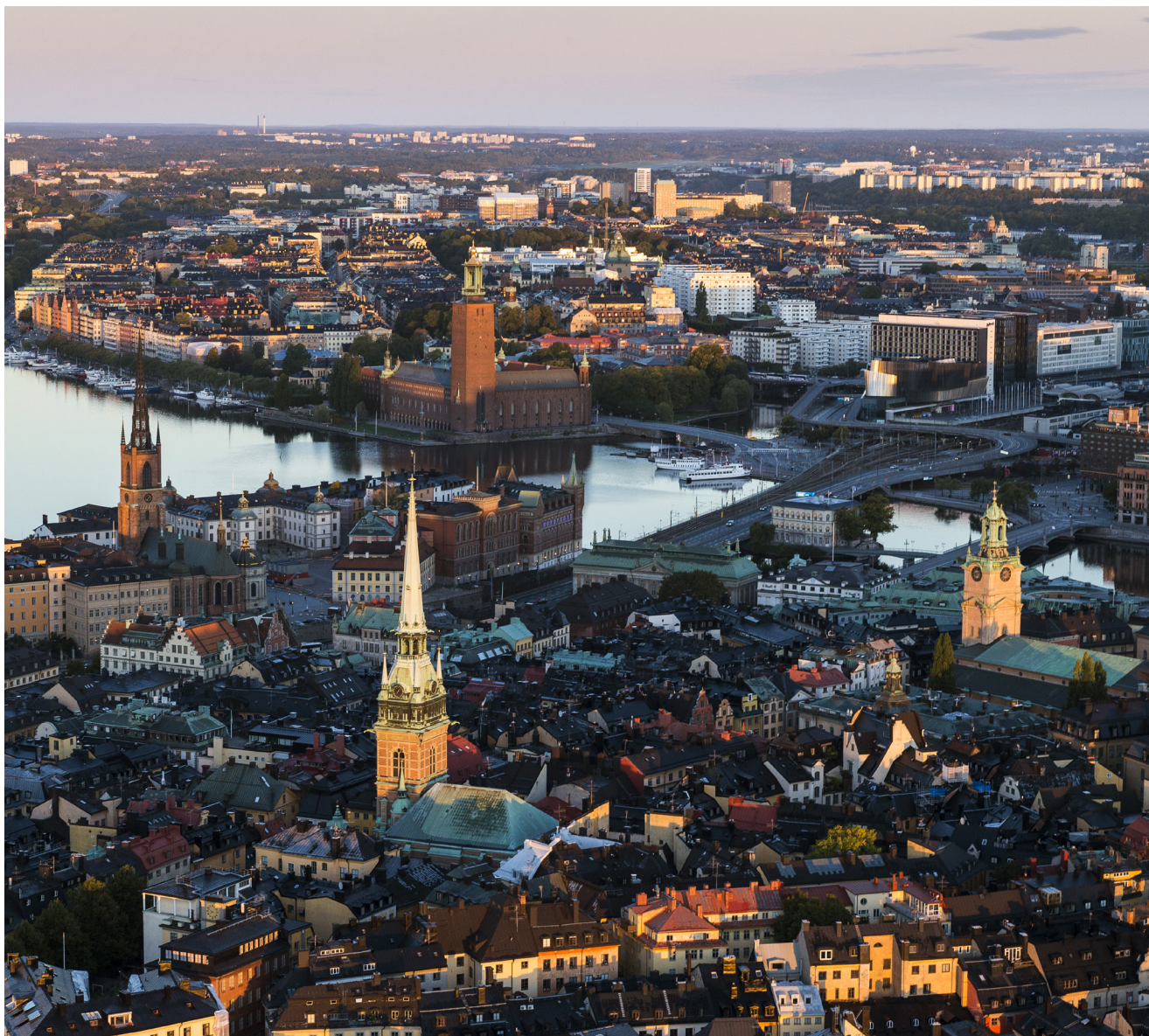
Vista de Estocolmo.